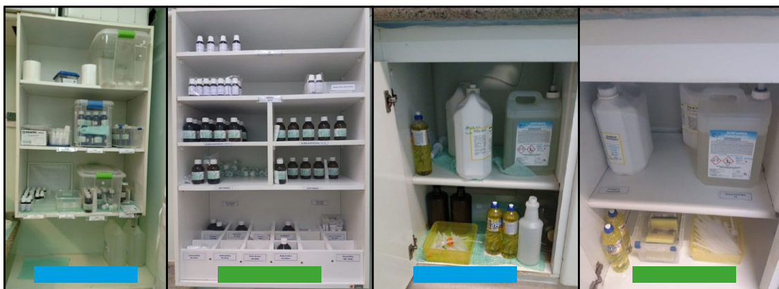
Figura 4. Implementação do Programa 5S, com vista antes (verde) e depois (azul) no laboratório de saneantes (Campinas, São Paulo, Brasil, 2021)