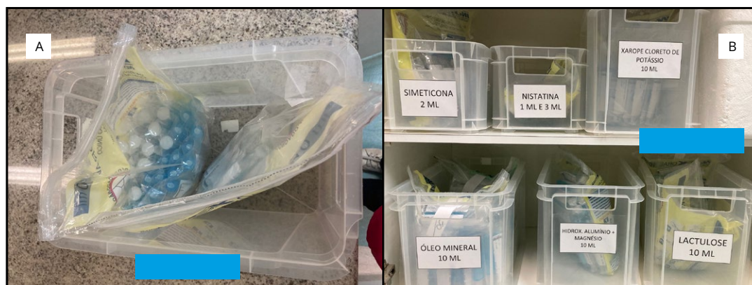
Figura 3. Implementação do Programa 5S, com vista depois (azul) na farmácia central, organizando os dosadores orais (A) e aplicando etiquetas de identificação (B) (Campinas, São Paulo, Brasil, 2021)

Na Figura 3A observa-se que dosadores orais com volumes idênticos, mas contendo diferentes medicamentos, foram armazenados em caixas plásticas com identificação grande e visível, ao invés de sacos plásticos. Esta alteração propiciou menores chances de medicamentos diferentes misturarem-se por engano durante o armazenamento. A Figura 3B mostra a aplicação de etiquetas de identificação dos bins de medicamentos por nome e classe terapêutica, com definição de quantidades mínimas e máximas. Assim, excessos ou faltas no estoque passaram a ser evitados.