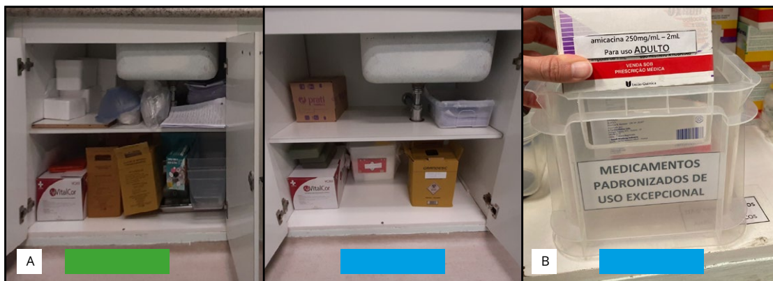
Figura 2. Implementação do Programa 5S, com vista antes (verde) e depois (azul) na farmácia central, tanto na prateleira para armazenar caixas de descarte (A) quanto no armazenamento de medicamentos (B) (Campinas, São Paulo, Brasil, 2021)