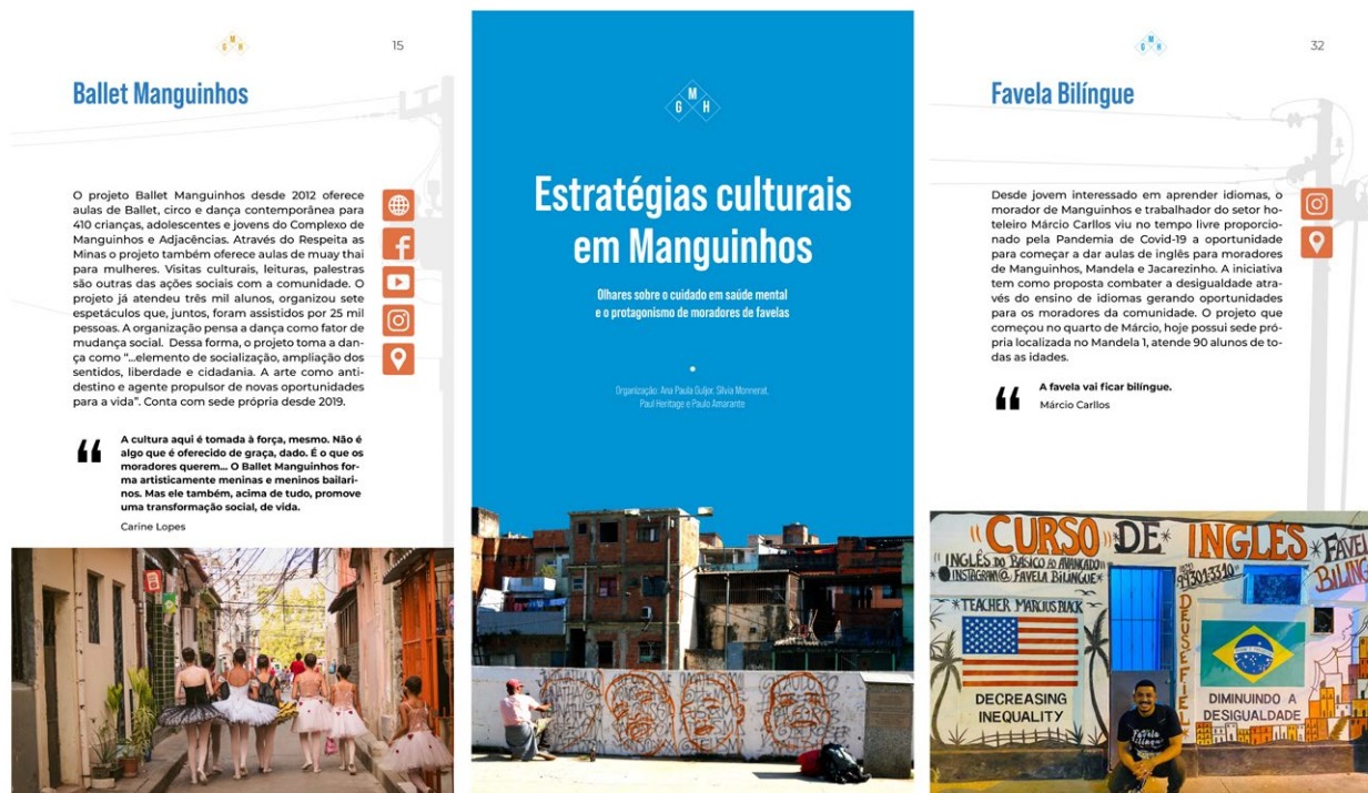
Figura 1 Catálogo Estratégias Culturais em Manguinhos: Olhares sobre o cuidado em saúde mental

Nota. Páginas selecionadas do catálogo digital desenvolvido durante a pesquisa, ilustrando as iniciativas Ballet Manguinhos e Favela Bilingue. Reproduzido de Guljor et al. (2022) .